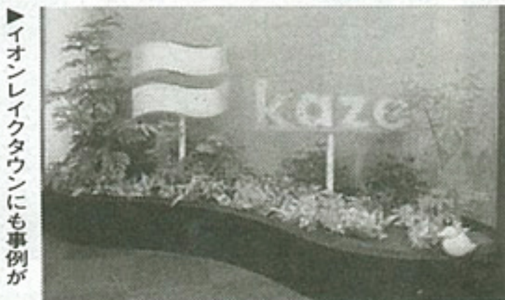
イオンレイクタウンにも事例が