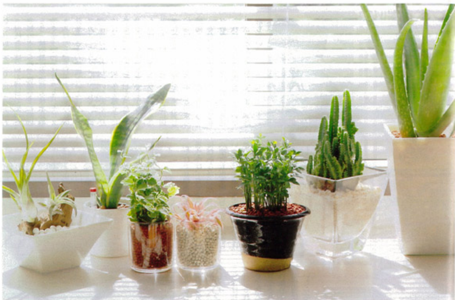
緑は「安心・安定」の色。心を穏やかにする鎮静効果があるとされている。観葉植物は心も体も癒してくれるはずだ