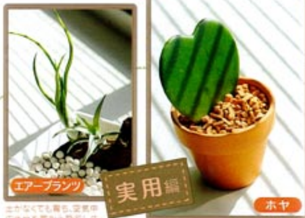
エアープランツ ホヤ エアープランツは水がなくても育ち、空気中の水分を葉から吸収し生長する。水やりをしない代わりに週2回霧吹きをすればよく育つ。 ホヤは葉がハート形のものにはハート形で、スイートハートなどという名で流通している。