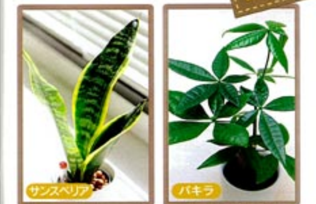
サンスベリア パキラ 名前「虎の尾」、乾燥に強く、マイナスイオンを他の観葉植物よりも多く放出する。 生長力が旺盛で、中国では「良財樹」「お宝を生み出す木」とも言われている。