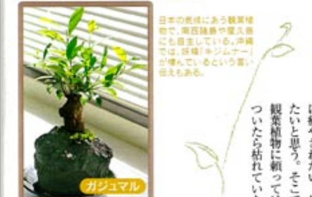
セレウス・ベルグヴィアヌス ガジュマル 日本の気候に合う観葉植物で、南国風や夏風にも馴染んでいる。沖縄では「結婚の木」「縁起木」とも言われている。