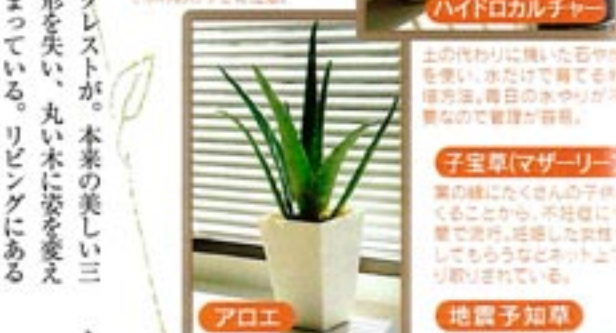
アロエ 子宝草(マザーリーフ) 葉の縁にたくさんの子株の蕾が育つことから、不妊症に悩む女性で流行。妊婦に与えても大丈夫とネット上で取りまわされている。 地震予知草 (sensitive plant)といわれる植物で、地震から数分前に入力された電磁波が検出されている。