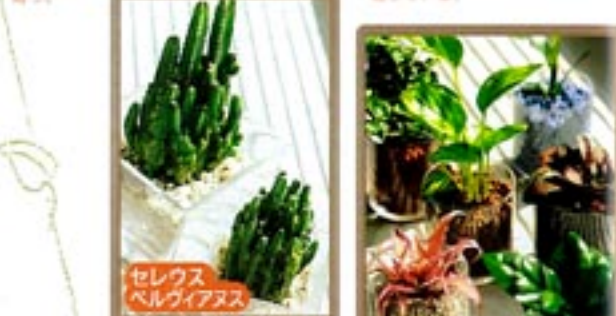
セレウス・ベルグヴィアヌス ハイドロカルチャー 霧吹きを必要とするときや、土の代わりに使った石や水を使い、水だけで育てる栽培方法。毎日の水やりが不要なので管理が容易。